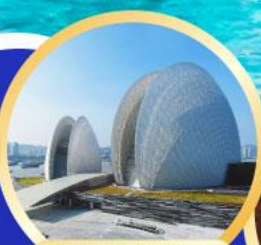
โรส-ครอยโซ่