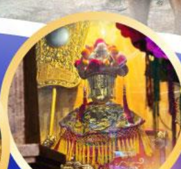
วัดอาบ่า